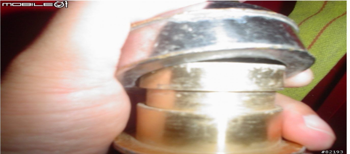
水帶的公接頭..插進瞄子的母接頭