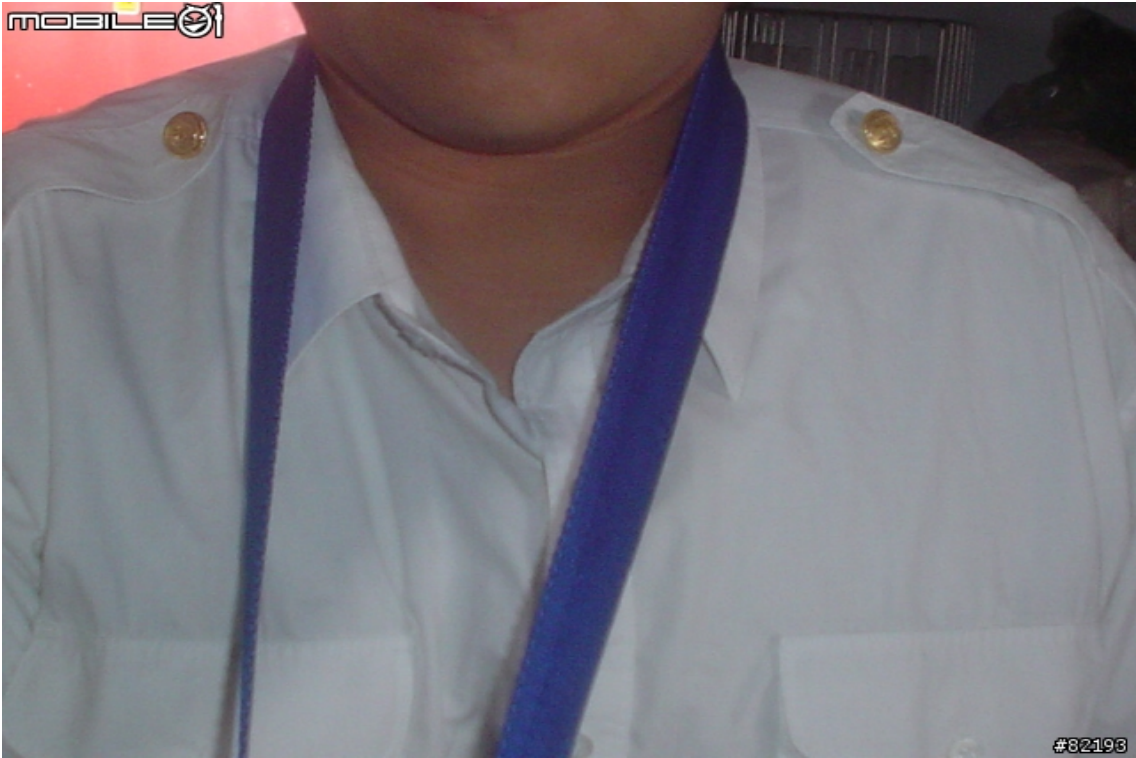
好像戴項鍊一樣戴進去...