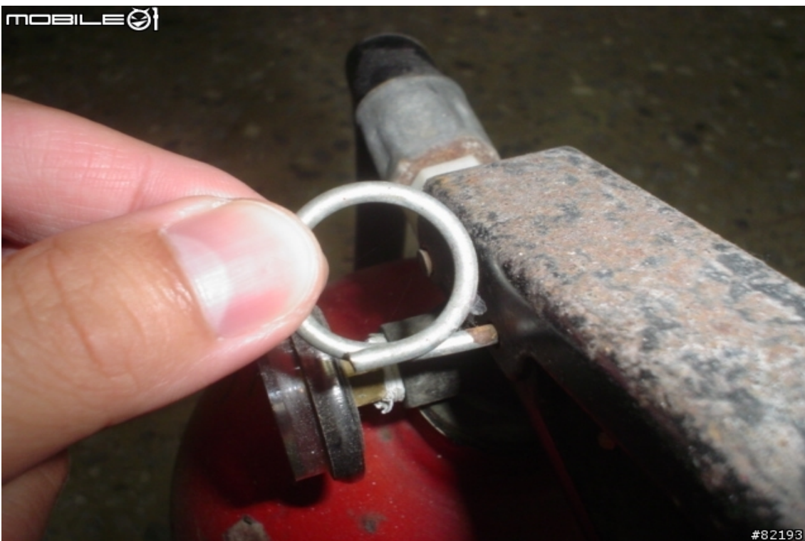
我手握的就是安全插針.