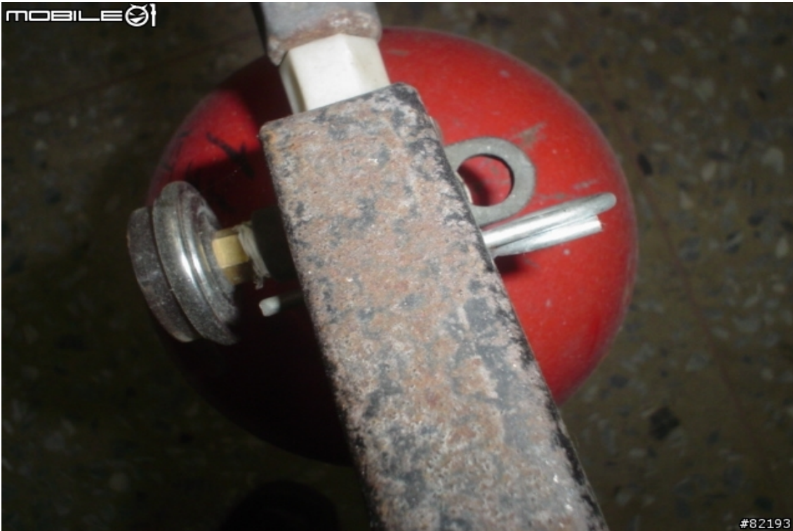
保險插針俯視圖..插哪邊都沒關係